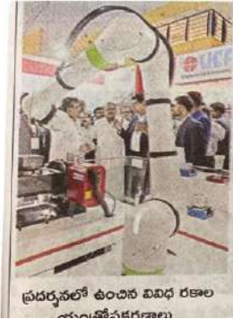
ప్రదర్శనలో ఉంచిన వివిధ రకాల యంత్రోపకరణాలు