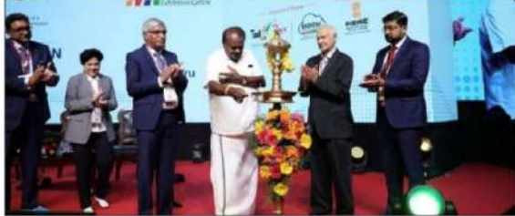
ಭಾರತದ ಆರ್ಥಿಕತೆಗೆ ಗಮನಾರ್ಹ ಕೊಡುಗೆ ನೀಡುತ್ತದೆ. ಈ ಪ್ರದರ್ಶನವು ಭಾರತೀಯ ಮತ್ತು ಜಾಗತಿಕ ಯಂತ್ರೋಪಕರಣ ಉದ್ಯಮಗಳ ಇತ್ತೀಚಿನ ಪ್ರವೃತ್ತಿಗಳು ಮತ್ತು ತಾಂತ್ರಿಕ ಪ್ರಗತಿಗಳನ್ನು ಪ್ರದರ್ಶಿಸುತ್ತದೆ ಎಂದರು. ಕರ್ನಾಟಕ ಸರ್ಕಾರದ ಟ್ಯಾಕ್ಸ್ ಮತ್ತು ಮಧ್ಯಮ ಕೈಗಾರಿಕೆಗಳು ಹಾಗೂ ಮೂಲಸೌಕರ್ಯ ಅಭಿವೃದ್ಧಿ ಸಚಿವ ಎಂ.ಬಿ. ಶಾಟೀಲ್ ಮಾತನಾಡಿ,

ಬೆಂಗಳೂರು: ಸದ್ಯದ ಉತ್ಪಾದನಾ ವಲಯಕ್ಕೆ ಬಲವಾದ ಯಂತ್ರೋಪಕರಣಗಳ ಉದ್ಯಮ ಅಗತ್ಯವಾಗಿದೆ ಎಂದು ಕೇಂದ್ರದ ಕೈಗಾರಿಕೆ ಮತ್ತು ಉಕ್ಕು ಸಚಿವ ಹೆಚ್.ಡಿ.ಕುಮಾರಸ್ವಾಮಿ ಹೇಳಿದರು. ಇಲ್ಲಿನ ಬಿಎಫ್ಸಿ ಯಲ್ಲಿ ಆಯೋಜಿಸಿದ್ದ ಇಂಡಿಯನ್ ಮೆಷಿನ್ ಟೂಲ್ ಮ್ಯಾನುಫ್ಯಾಕ್ಚರರ್ಸ್ ಅಸೋಸಿಯೇಷನ್ ನ ಪ್ರಮುಖ ಐಎಂಟಿಇಎಕ್ಸ್, ಟೂಲ್ಸ್ ಮತ್ತು ಡಿಜಿಟಲ್ ಮ್ಯಾನುಫ್ಯಾಕ್ಚರಿಂಗ್-2025 ಅನ್ನು ಔಪಚಾರಿಕವಾಗಿ ಉದ್ಘಾಟಿಸಿ ಮಾತನಾಡಿದ ಅವರು, ಕರ್ನಾಟಕ ಭಾರತದ ಸುಮಾರು 50% ಯಂತ್ರೋಪಕರಣಗಳನ್ನು ಉತ್ಪಾದಿಸುತ್ತದೆ. ಹೀಗಾಗಿ ಇದನ್ನು ಭಾರತದ ಯಂತ್ರೋಪಕರಣಗಳ ರಾಜಧಾನಿ ಎಂದು ಕರೆಯಲಾಗುತ್ತದೆ. ಯಂತ್ರೋಪಕರಣ ಉದ್ಯಮವು ಬಂಡವಾಳ ಸರಣಿಗಳ ವಲಯದ ಭಾಗವಾಗಿದ್ದು, ಉದ್ಯೋಗ ಸೃಷ್ಟಿಸುವುದರ ಜೊತೆಗೆ