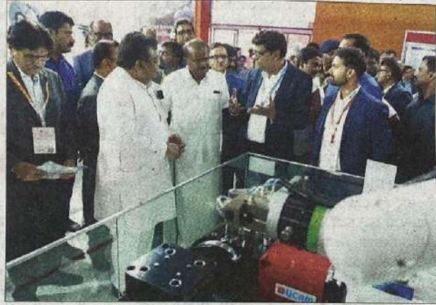
ಬೆಂಗಳೂರು ಅಂತಾರಾಷ್ಟ್ರೀಯ ಪ್ರದರ್ಶನ ಕೇಂದ್ರದಲ್ಲಿ ಆಯೋಜಿಸಲಾಗಿರುವ ಭಾರತೀಯ ಯಂತ್ರೋಪಕರಣ ತಂತ್ರಜ್ಞಾನ ಪ್ರದರ್ಶನವನ್ನು ಗುರುವಾರ ಕೇಂದ್ರ ಬೃಹತ್ ಕೈಗಾರಿಕೆ ಮತ್ತು ಉಕ್ಕು ಸಚಿವ ಎಚ್.ಡಿ. ಕುಮಾರಸ್ವಾಮಿ ಉದ್ಘಾಟಿಸಿದರು.

• ಕನ್ನಡಪ್ರಭ ವಾರ್ತೆ ಬೆಂಗಳೂರು ನಾವೀನ್ಯತೆ ಉತ್ತೇಜಿಸಲು, ಆಮದು ಮೇಲಿನ ಅವಲಂಬನೆ ಕಡಿಮೆ ಮಾಡಲು ಶೀಘ್ರದಲ್ಲೇ 'ರಾಷ್ಟ್ರೀಯ ಬಂಡವಾಳ ಸರಕುಗಳ ನೀತಿ-2025' ಪ್ರಕಟಿಸಲಾಗುವುದು ಎಂದು ಕೇಂದ್ರ ಬೃಹತ್ ಕೈಗಾರಿಕೆ ಮತ್ತು ಉಕ್ಕು ಸಚಿವ ಎಚ್.ಡಿ. ಕುಮಾರಸ್ವಾಮಿ ತಿಳಿಸಿದರು.