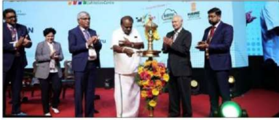
ಭಾರತದ ಆರ್ಥಿಕತೆಗೆ ಗಮನಾರ್ಹ ಕೊಡುಗೆ ನೀಡುತ್ತದೆ. ಈ ಪ್ರದರ್ಶನವು ಭಾರತೀಯ ಮತ್ತು ಜಾಗತಿಕ ಯಂತ್ರೋಪಕರಣ ಉದ್ಯಮಗಳ ಇತ್ತೀಚಿನ ಪ್ರವೃತ್ತಿಗಳು ಮತ್ತು ತಾಂತ್ರಿಕ ಪ್ರಗತಿಗಳನ್ನು ಪ್ರದರ್ಶಿಸುತ್ತದೆ ಎಂದರು. ಕರ್ನಾಟಕ ಸರ್ಕಾರದ ಬೃಹತ್ ಮತ್ತು ಮಧ್ಯಮ ಕೈಗಾರಿಕೆಗಳು ಹಾಗೂ ಮೂಲಸೌಕರ್ಯ ಅಭಿವೃದ್ಧಿ ಸಚಿವ ಎಂ.ವಿ. ಪಾಟೀಲ್ ಮಾತನಾಡಿ,

ಬೆಂಗಳೂರು: ಸದ್ಯದ ಉತ್ಪಾದನಾ ವಲಯಕ್ಕೆ ಬಲವಾದ ಯಂತ್ರೋಪಕರಣಗಳ ಉದ್ಯಮ ಅಗತ್ಯವಾಗಿದೆ ಎಂದು ಕೇಂದ್ರದ ಕೈಗಾರಿಕೆ ಮತ್ತು ಉಕ್ಕು ಸಚಿವ ಹೆಚ್.ಡಿ.ಕುಮಾರಸ್ವಾಮಿ ಹೇಳಿದರು. ಇಲ್ಲಿನ ವಿಜಯನಿ ಯಲ್ಲಿ ಆಯೋಜಿಸಿದ್ದ ಇಂಡಿಯನ್ ಮಿಷಿನ್ ಟೂಲ್ ಮ್ಯಾನುಫ್ಯಾಕ್ಚರರ್ಸ್ ಅಸೋಸಿಯೇಷನ್ ನ ಪ್ರಮುಖ ಐಎಂಟಿಇಎಲ್, ಟೂಲ್ಸ್ ಮತ್ತು ಡಿಜಿಟಲ್ ಮ್ಯಾನುಫ್ಯಾಕ್ಚರಿಂಗ್-2025 ಅನ್ನು ಔಪಚಾರಿಕವಾಗಿ ಉದ್ಘಾಟಿಸಿ ಮಾತನಾಡಿದ ಅವರು, ಕರ್ನಾಟಕ ಭಾರತದ ಸುಮಾರು 50% ಯಂತ್ರೋಪಕರಣಗಳನ್ನು ಉತ್ಪಾದಿಸುತ್ತದೆ. ಒಣಗಿ ಇದನ್ನು ಭಾರತದ ಯಂತ್ರೋಪಕರಣಗಳ ರಾಜಧಾನಿ ಎಂದು ಕರೆಯಲಾಗುತ್ತದೆ. ಯಂತ್ರೋಪಕರಣ ಉದ್ಯಮವು ಬಂಡವಾಳ ಸರಕುಗಳ ವಲಯದ ಭಾಗವಾಗಿದ್ದು, ಉದ್ಯೋಗ ಸೃಷ್ಟಿಸುವುದರ ಜೊತೆಗೆ