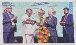
కార్యక్రమ ప్రారంభ శోభిల్లి వెలిగిస్తున్న కుమారస్వామి

యని తెలిపారు. ఈ పరిశ్రమలకు ప్రధానమంత్రి నరేంద్రమోదీ ప్రోత్సాహాన్ని అందిస్తున్నారని చెప్పారు. శుభవార్తలో మెడిన్ అండ్ టూల్స్ పార్కు, ఐఐఐఐఐఎల్ మెరుగైన ఉత్పాదన సాంకేతిక ఉత్పత్తి కేంద్రాల ఏర్పాటుకు తీసుకుంటున్న చర్యలను వివరించారు. పోటీ ప్రపంచంలో మెరుగైన, నాణ్యతలో కూడిన ఉత్పత్తులే పదిహాల పాటు నిలుపుాయని చెప్పారు. ప్రదర్శనలో జాగ్రత్తగా ఏర్పాటు చేసిన స్టాళ్లను కుమారస్వామి, ఎం.పి. పాటిల్, ఇతర అధికారులు పరిశీలించారు. ఆయన యంత్రోపకరణాలు, వాటి వివరాలను తెలుసుకున్నారు.