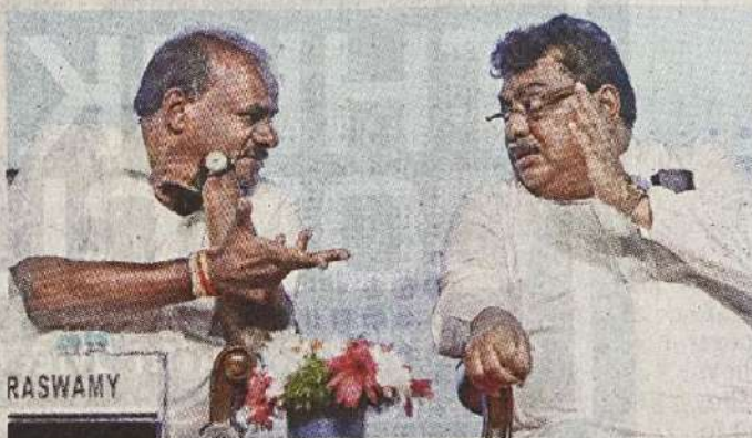
Union minister HD Kumaraswamy has a word with Industries Minister MB Patil at the inauguration of 'IMTEX 2025' in Bengaluru of Thursday

Kumaraswamy acknowledged the government's ef-